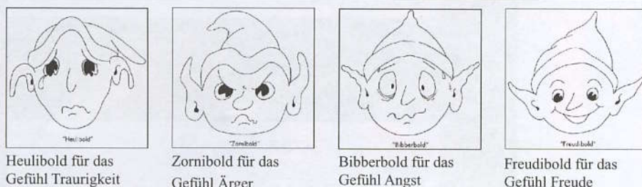
Abbildung 2: Bildkarten zu Paula und die Kistenkobelde